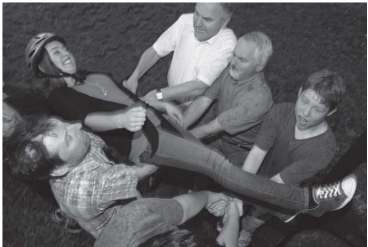
Vetruuen auf die Mitmenschen... der „Vertrauensfall“