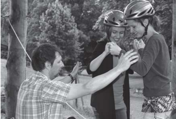
Im Niederseilgarten- Parcour...