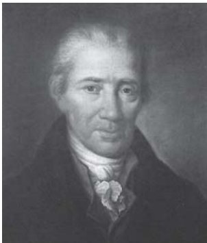
Johann Georg Albrechtsberger