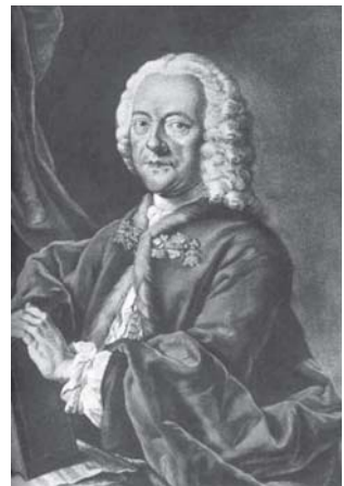
Georg Philipp Telemann